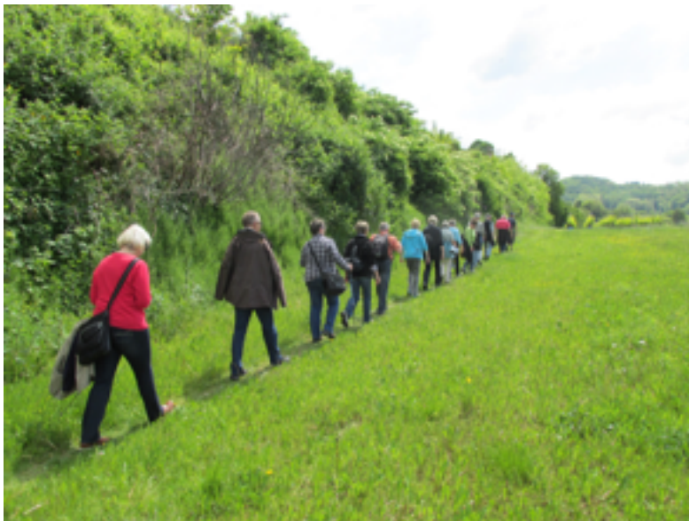
Bild im Winzerhof

Mit speziellen örtlichen Köstlichkeiten (Kuchen) beschlossen wir den Nachmittag im Winzerhof unseres Wanderführers.